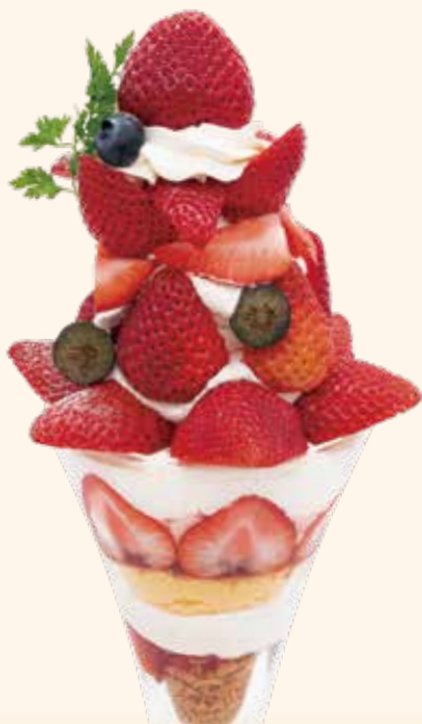
いちごパフェ Strawberry Parfait