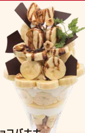
チョコバナナ パフェ Chocolate Banana Parfait