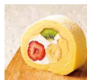
市場ロール(カット) Market roll cake (cut) ¥509 【ドリンクセット】 ¥839