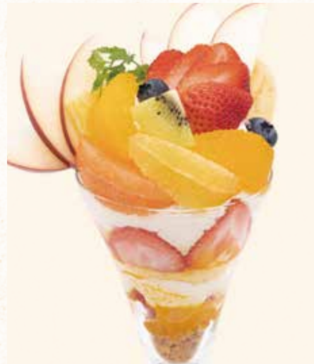
フルーツパフェ Fruit parfait

たっぷりの福岡県産「あまおう」と北海道生クリームいちごアイスの奏でるハーモニーをご堪能ください。