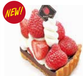
あまおうタルト(チョコ) Amaou strawberry tart (chocolate) ¥1,405 【ドリンクセット】 ¥1,735