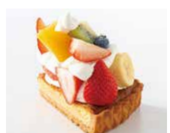
いろいろタルト Various tart ¥855 【ドリンクセット】 ¥1,185