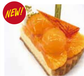
温州みかんのチーズタルト Satsuma orange cheese tart ¥693 【ドリンクセット】 ¥1,023