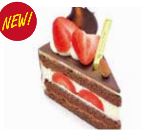
ガナッシュ・フレーズ(あまおう) Ganache fraise (amaou strawberry) ¥896 【ドリンクセット】 ¥1,226