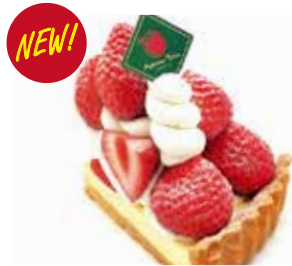
あまおうタルト(チーズ) Amaou strawberry tart (cheese) ¥1,405 【ドリンクセット】 ¥1,735