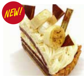
完熟バナナモンブランタルト Ripened banana mont blanc tart ¥693 【ドリンクセット】 ¥1,023