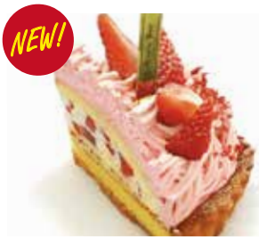
あまおうモンブランタルト Amaou strawberry mont blanc tart ¥815 【ドリンクセット】 ¥1,145