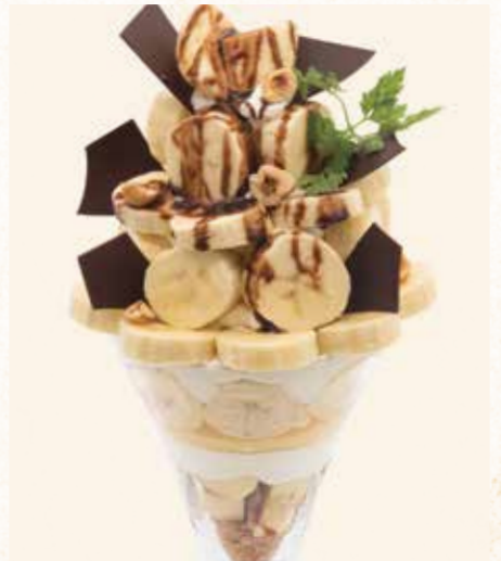
チョコバナナパフェ Chocolate banana parfait

彩り豊かな新鮮フルーツをたっぷりを使用した人気のパフェ。口いっぱいに広がるフルーツの香りをお楽しみください。