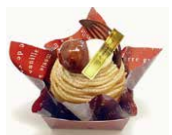
蒸し栗モンブラン Steamed chestnut mont blanc ¥774 【ドリンクセット】 ¥1,104