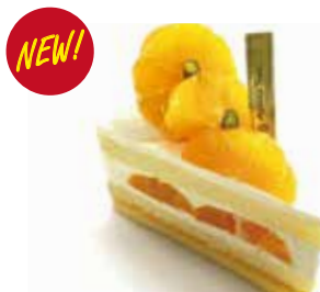
温州みかんショート Satsuma orange sponge cake ¥468 【ドリンクセット】 ¥798