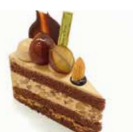
渋皮栗の生チョコショート Chestnut ganache sponge cake ¥550 【ドリンクセット】 ¥880