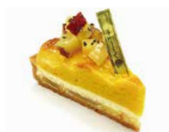
スイートなポテトチーズタルト Sweet potato cheese tart ¥489 【ドリンクセット】 ¥819