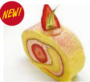
あまおうロール~あまおう練乳クリーム仕立て~(カット) Amaou strawberry roll cake ~amaou condensed milk cream~ (cut) ¥509 【ドリンクセット】 ¥839