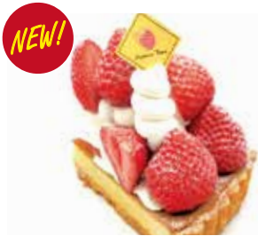
あまおうタルト(ダイヤモンド) Amaou strawberry tart (diamond) ¥1,405 【ドリンクセット】 ¥1,735