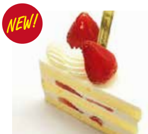
あまおうショート Amaou strawberry sponge cake ¥795 【ドリンクセット】 ¥1,145